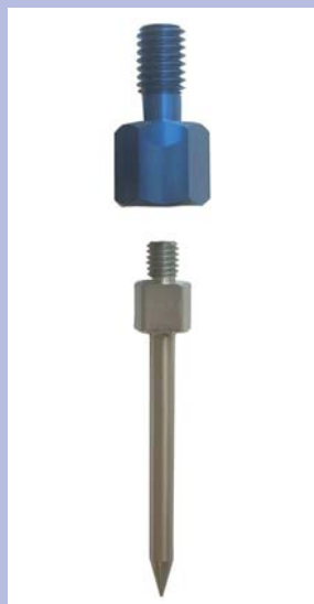
先細部の 交換が可能